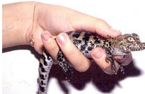
O jacaré de papo amarelo recém-nascido